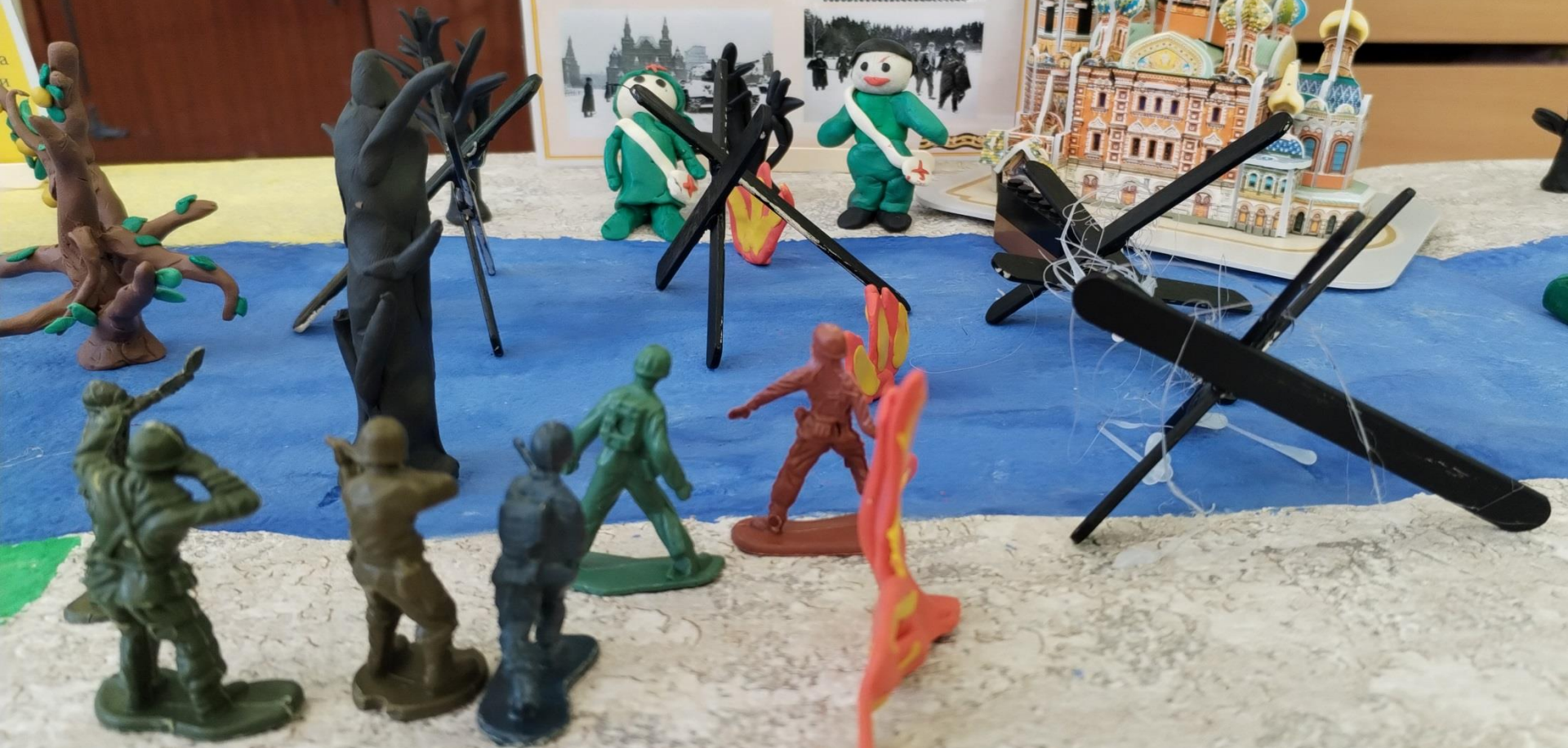
Битва за Москву