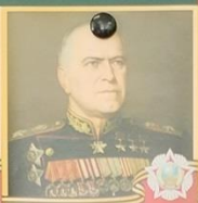
ЖУКОВ Георгий Константинович 1896 — 1974 гг. Маршал Советского Союза