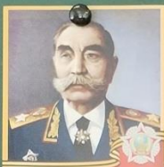
БУДЕННЫЙ Семён Михайлович 1883 — 1973 Маршал Советского Союза