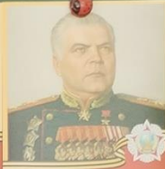
МАЛИНОВСКИЙ Родион Яковлевич 1898 — 1967 Маршал Советского Союза