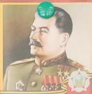
СТАЛИН Иосиф Виссарионович 1878 — 1953 Маршал Советского Союза