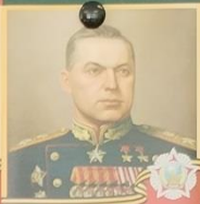
РОКОССОВСКИЙ Константин Константинович 1896 — 1968 Маршал Советского Союза