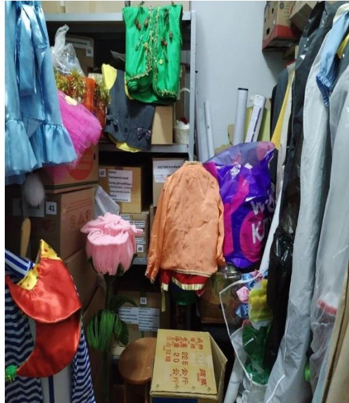
До оптимизации пространства